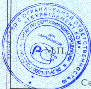
Схема сертификации 3с.